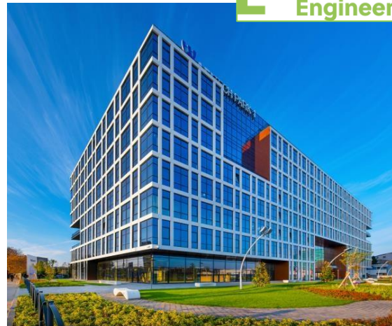
Proiect: AFI Tech Park Suprafata: 1.250 mp