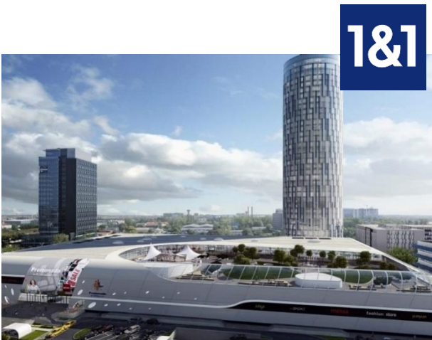
Proiect: SKYTOWER Suprafata: 3.500 mp