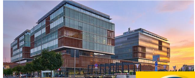
Proiect: CITY BC – Timisoara Suprafata: 4.000 mp