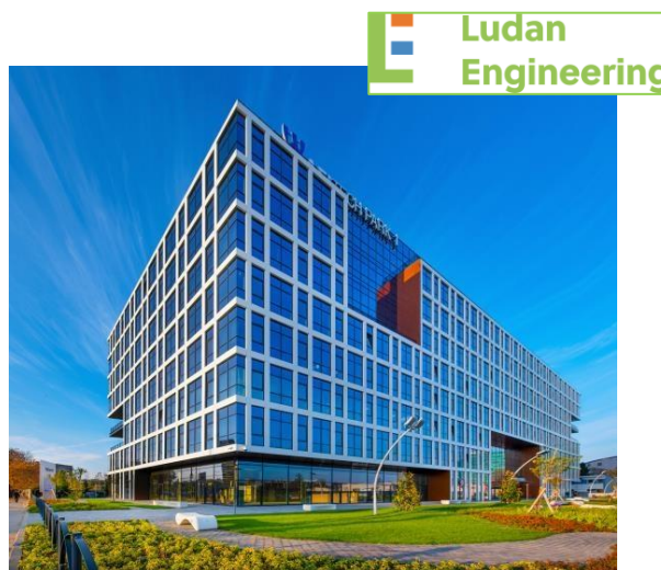
Proiect: AFI Tech Park Suprafata: 1.250 mp