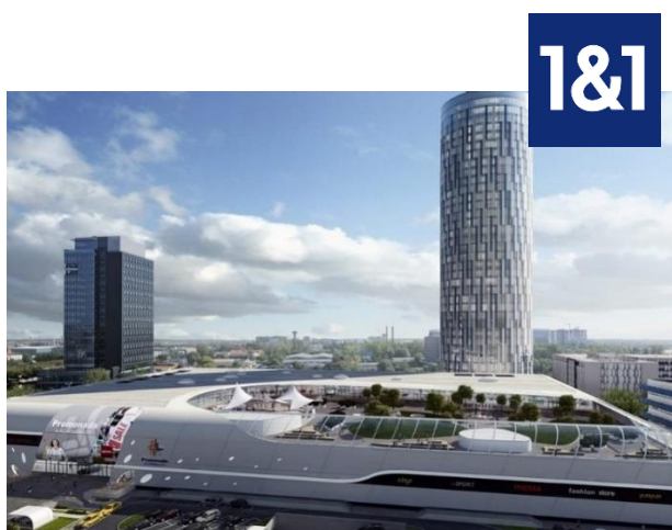
Proiect: SKYTOWER Suprafata: 3.500 mp