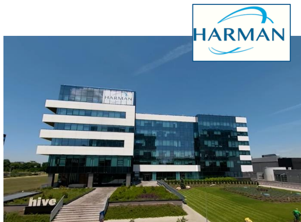
Proiect: METROFFICE Suprafata: 10.500 mp