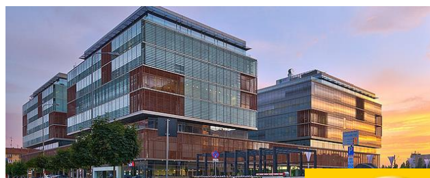
Proiect: CITY BC – Timisoara Suprafata: 4.000 mp